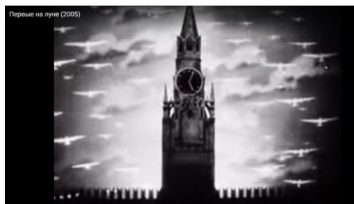
Рис. 3 (URL:

ганда возвращается к визуальной риторике незыблемой и вечной власти государства.