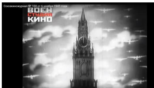
Рис. 2 (URL:

Этот образ использовался и в последующих выпусках «Союзкиножурнала», но подвергся значительным изменениям в первые годы войны — например, см.: Союзкиножурнала, № 104 за 6 ноября 1941 г.: